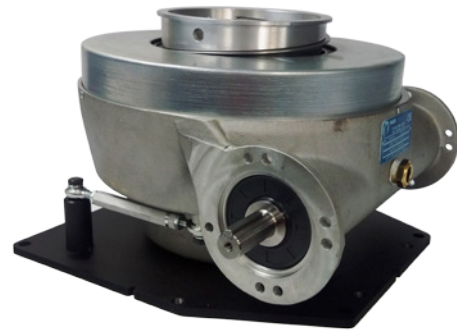
Spiralift HD6 // View 01